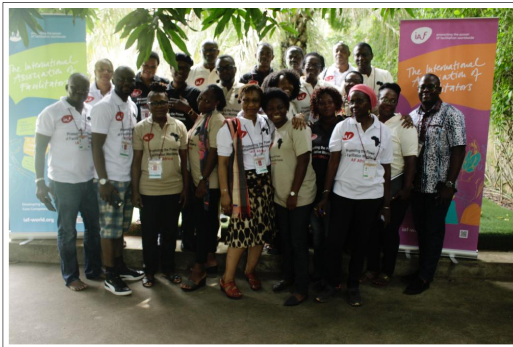
Photo de Groupe à la fin de l'activité de plein air