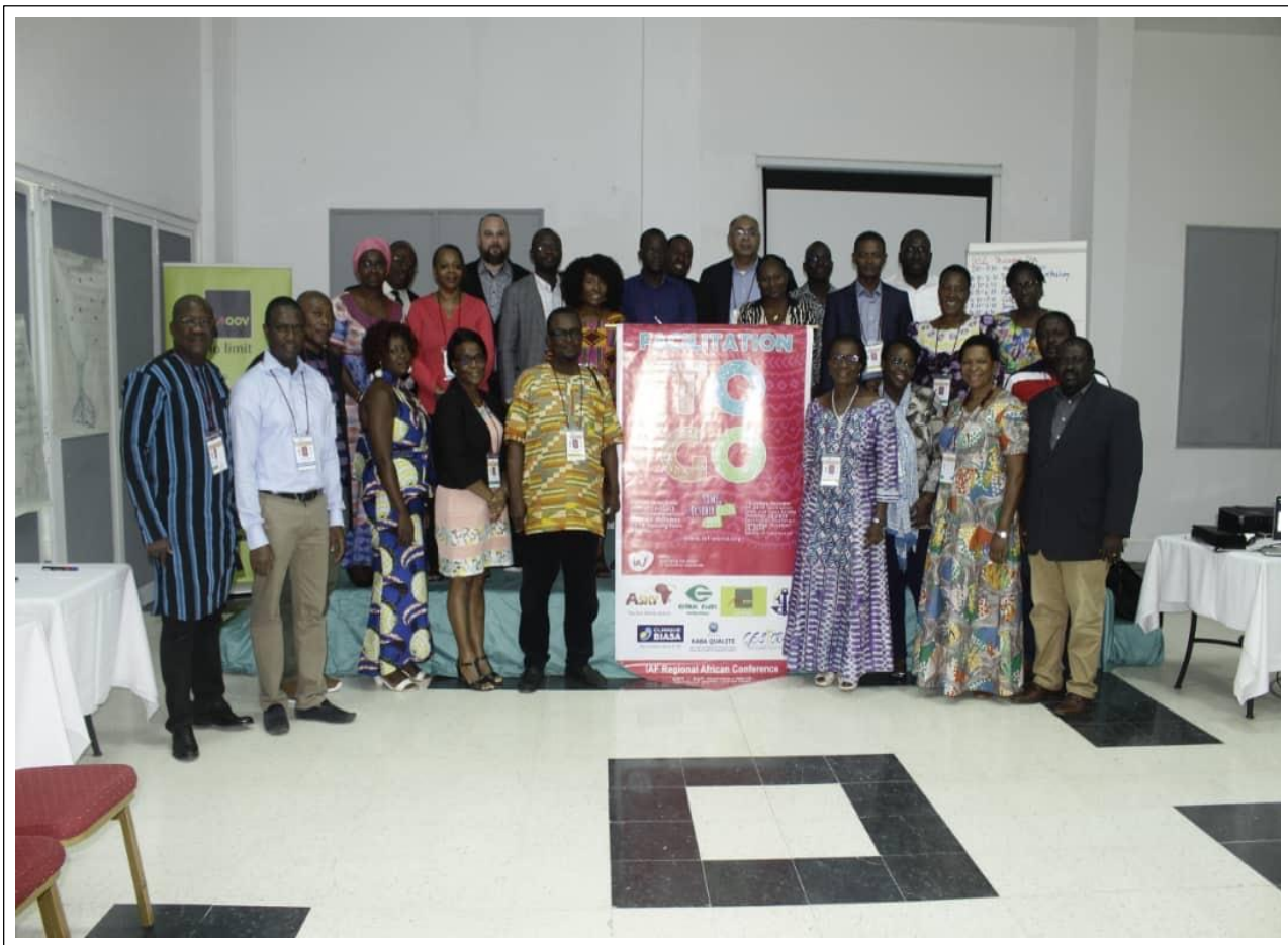
Photo de Groupe prise lors de la séance d'ouverture (25 participants)